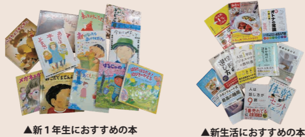
▲新1年生におすすめの本 ▲新生活におすすめの本