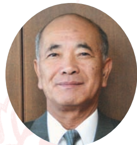
錦江町長 野元良一