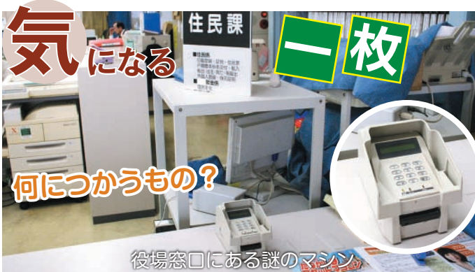
役場窓口にある謎のマシン