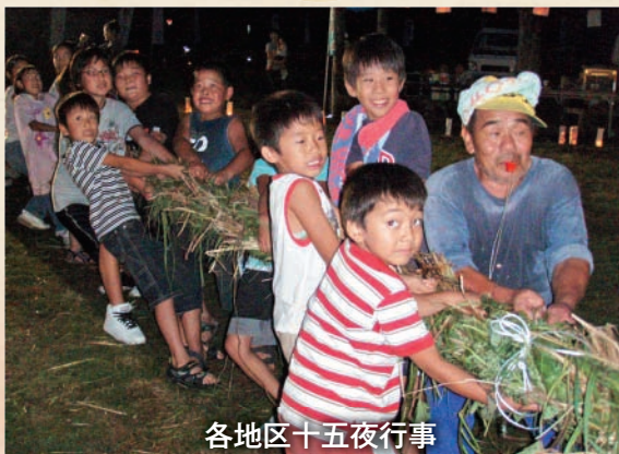
各地区十五夜行事