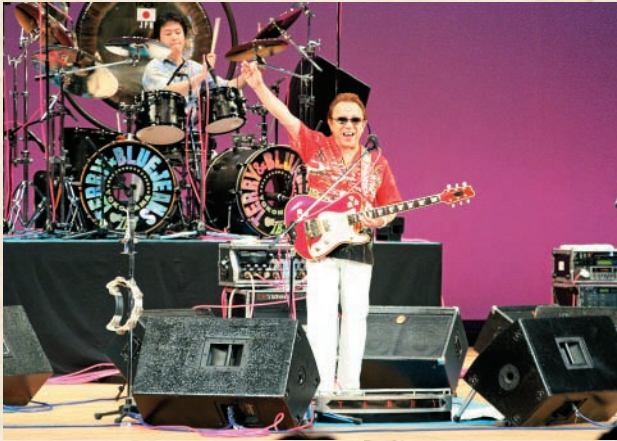
自主文化事業(20日) (寺内たけしと ブルージーンズコンサート)