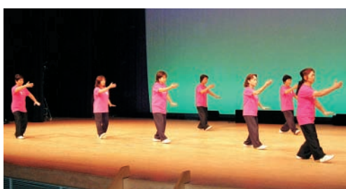
優雅な時間が流れます (太極拳)