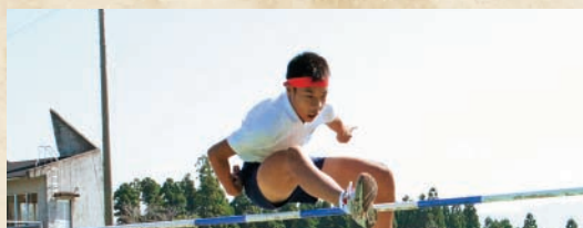
小学校陸上記録会 (16日)