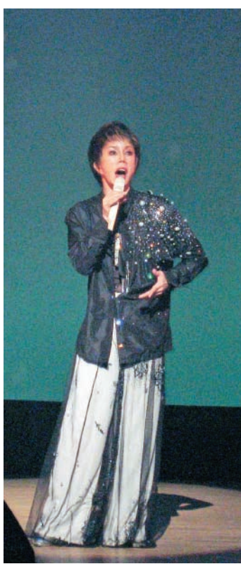
ベティさんの素敵なショー