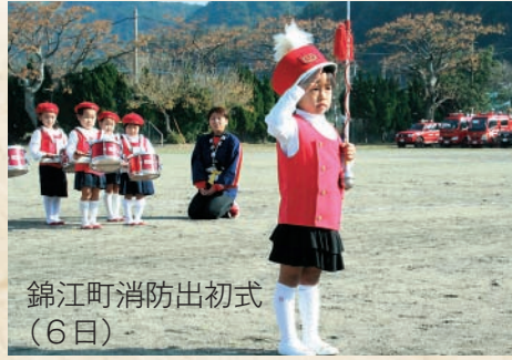
錦江町消防出初式 (6日)