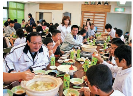
カンパチのしゃぶしゃぶに舌鼓