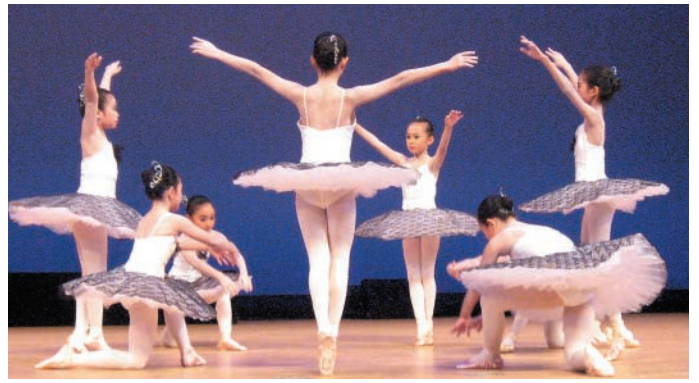
なんとも愛らしいクラシックバレエ