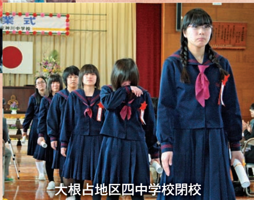
大根占地区四中学校閉校