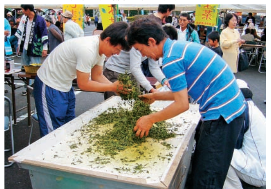
お茶の手もみ実演