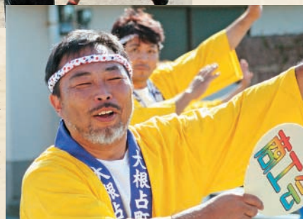
大根占納涼夏祭り (20日)