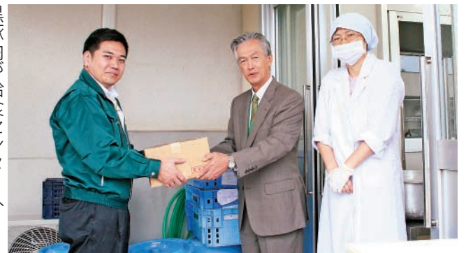
黒豚肉が給食センターへ