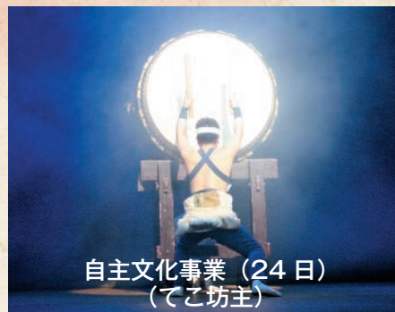
自主文化事業 (24日) (てこ坊主)