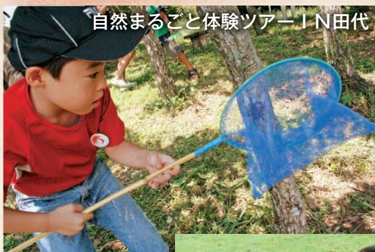
自然まるごと体験ツアー IN 田代