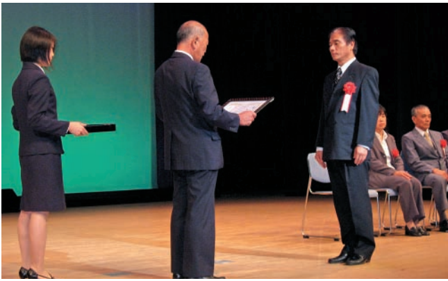
いきいき秋まつり部門表彰