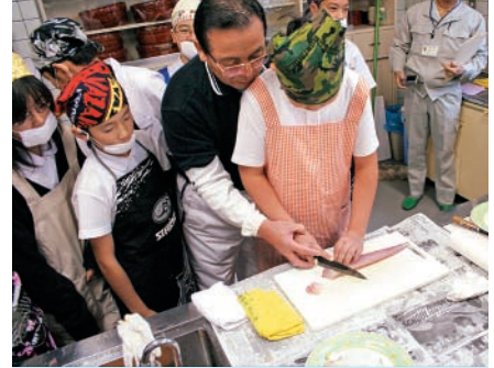
手ほどきを受けながら 魚をさばく児童