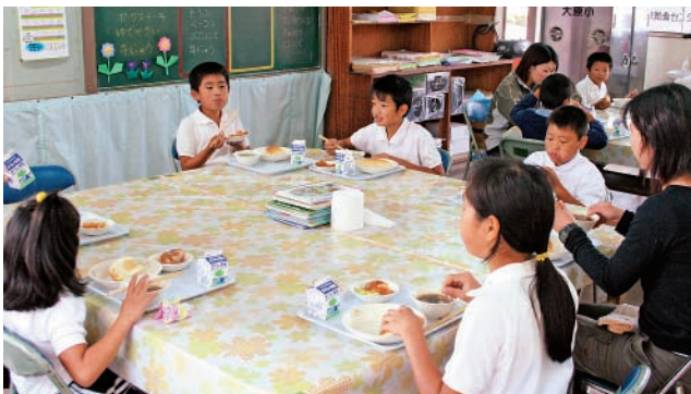
大原小の給食の様子