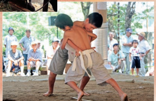
川原むらづくり 相撲大会 (24日)