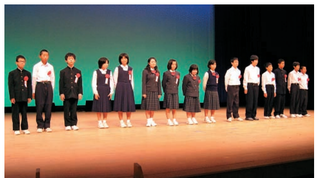
虫歯のない中学一年生の表彰