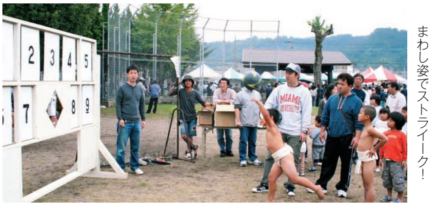
まわし姿でストライク!