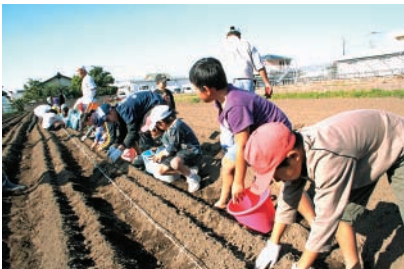
みんな並んでいっせいに植ええ

11月22日、馬場地区公民館子ども育成部（通称馬場っ子クラブ）が、山之口自治会の花壇の花植えとばれいしょの植ええを行いました。