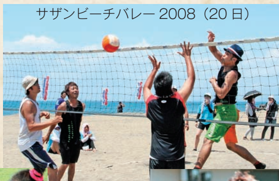
サザンビーチバレー 2008 (20日)