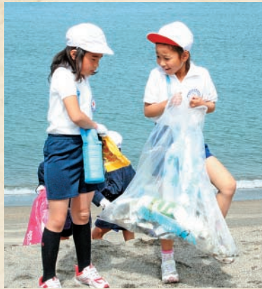
神川小ふるさと美化活動(2日)