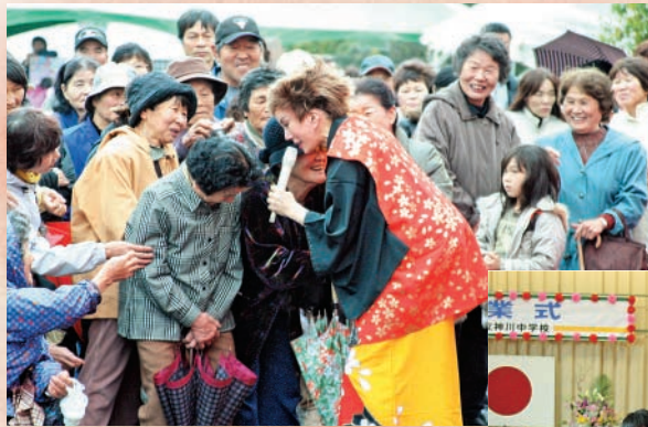
花瀬公園まつり (6日)