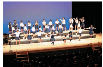
ダンスも披露した大根占小5年生