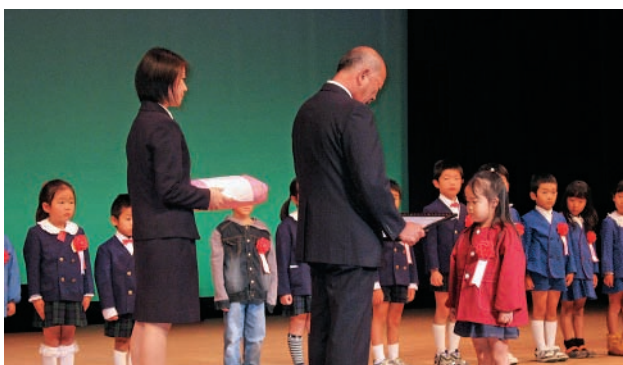
虫歯のない5歳児の表彰