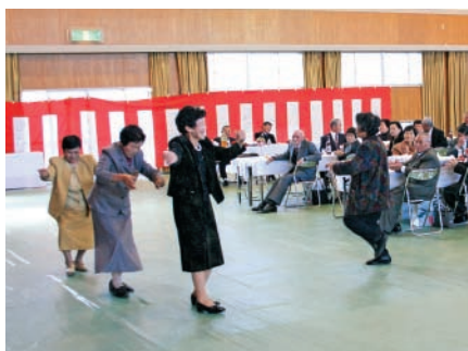
良き日に心が躍り、ハンヤ節を踊る