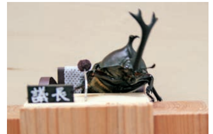
主人公のカブトムシ議長