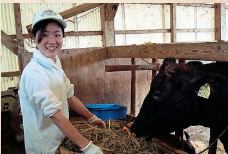
地域づくり インターン事業