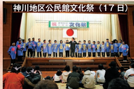
神川地区公民館文化祭 (17日)