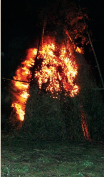
田代地区鬼火焚き (3日)