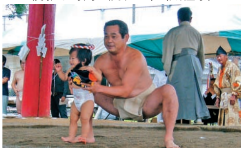
かわいい赤ちゃんの土俵入り!