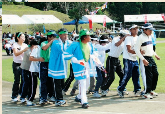
第4回 町民体育大会 (12日)