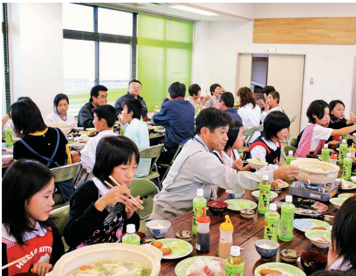
お魚料理っておいしいね♪ (関連記事5ページ)