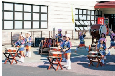
かわいい和太鼓の演奏