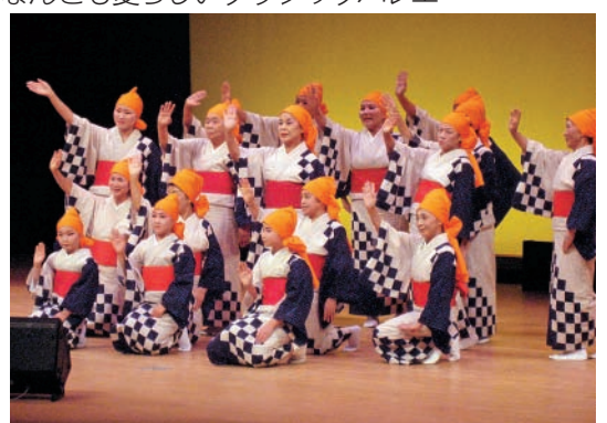
会場の声援に手を振って♪