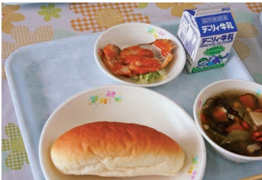
黒豚肉を使用した給食

たちは感謝の気持ちを持ちながら「おいしい。おいしい。」と口いっばいにはおぼつていました。もちろん大原小だけでなくすべての学校で好評でした。 現在、教育委員会では食育を推進するため、地元食材を給食に使用する地産地消の取り組みを行っております。町内にも農場がある南州農場からの黒豚肉の提供は地産地消の面においても、とても有意義なものであります。 南州農場のご厚意に深く感謝いたします。