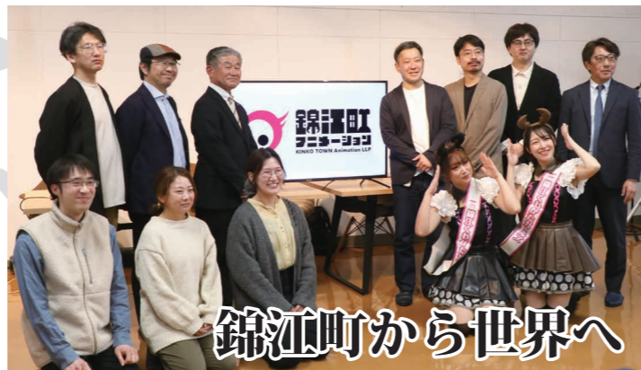
錦江町から世界へ

3月2日、錦江町から世界を目指す取組が始動し、記者発表が行われました。この取組は、アニメ業界で実績のある企業が集結し、錦江町でAIを活用して短編アニメを制作するというもの。毎年町が行っているアニメ教室が縁となり、今回実現したプロジェクトです。2027年中の完成を目指し、国際アニメーション映画祭への出品を予定しています。