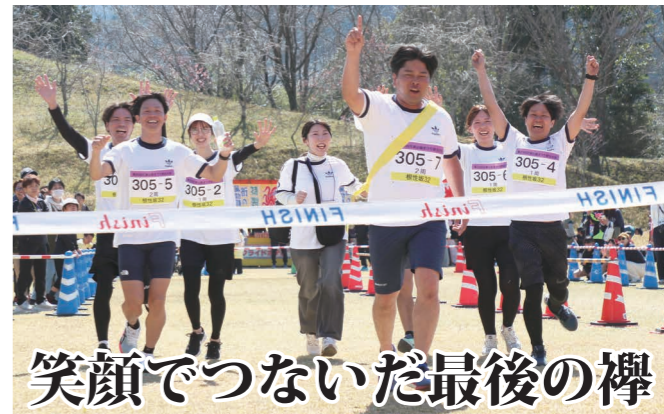
笑顔でつないだ最後の襷

私たち「根性坂 32」は田代小・中の同級生チームで、昨年参加しています。コースのことは、どのチームよりも熟知しています! 地元貢献したいという想いのもと、最後の大会を盛り上げることができました。花瀬駅伝が終わってしまうのは正直寂しいですが、私たちの地元を愛する気持ちは永遠です!