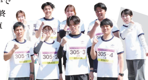
根性坂 32 の皆さん

私たち「根性坂 32」は田代小・中の同級生チームで、昨年参加しています。コースのことは、どのチームよりも熟知しています! 地元貢献したいという想いのもと、最後の大会を盛り上げることができました。花瀬駅伝が終わってしまうのは正直寂しいですが、私たちの地元を愛する気持ちは永遠です!