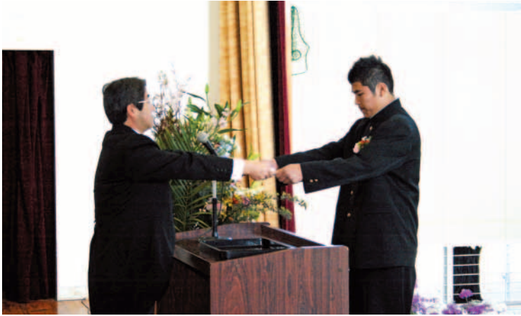
宿利原中学校最後、1,974人目の卒業生（卒業式より）