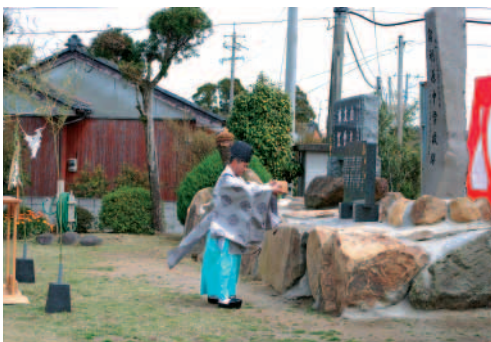
記念碑のお披露目の際に行われた神事。「宿利原中学校跡」と刻まれています。