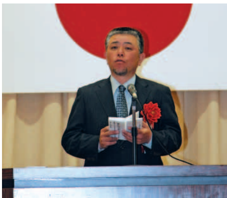
挨拶をする神川中最後のPTA会長