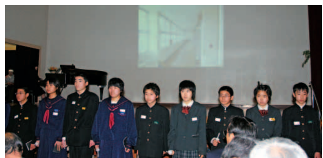
スライドショーで池田中の歴史を振り返る生徒。