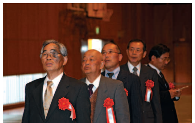
式典に出席された歴代校長（大根占中）感慨深いものがあるでしょう。

現在、少子化により児童・生徒の数が激減していますが錦江町の2つの中学校、6つの小学校を錦江町全体で盛り上げていきます。