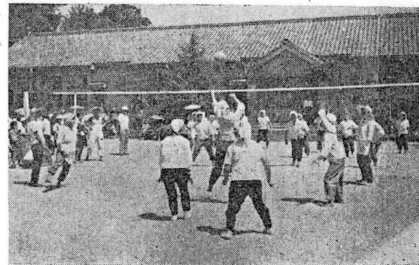
上 優勝旗を手にした上原婦人チームの選手達 下 試合風景

レントゲン検診は十五才以上全員受けましょう 実施期日 自九月十日 至九月二十二日