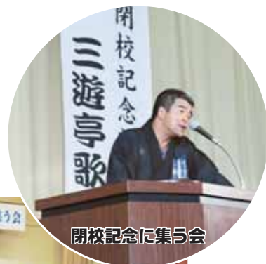
閉校記念に集う会