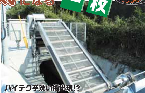
ハイテク芋洗い機出現!?