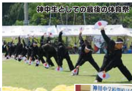
神中生としての最後の体育祭