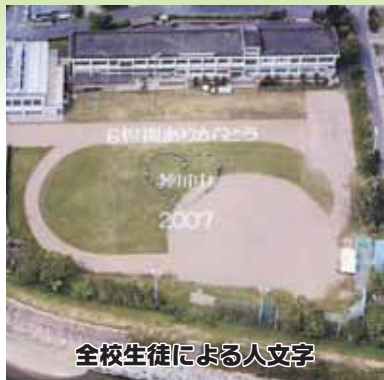
全校生徒による人文字

沿革史を紐解くと過去には剣道・テニス・野球・バレー・陸上等、部活動での輝かしい歴史を築いた時期があります。本年度は、8月に多くの卒業生の参加のもと、閉校の集いを開催しました。公民館と一体となり盛大な閉校行事を行うことができ、校区民の母校に寄せる熱い