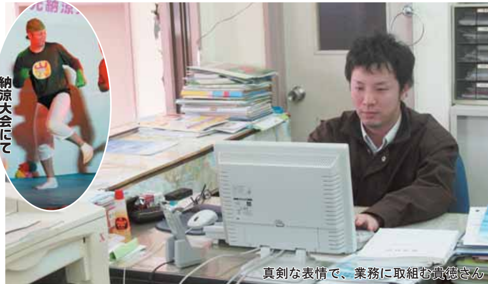
真剣な表情で、業務に取り組む貴徳さん