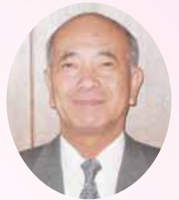
錦江町長 野元良一