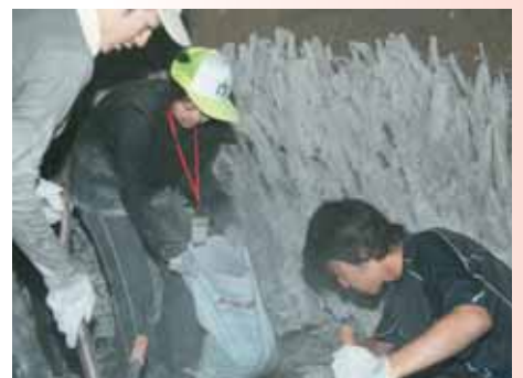
▲熱い炭焼き釜の中で真っ黒になりながら作業をしました。