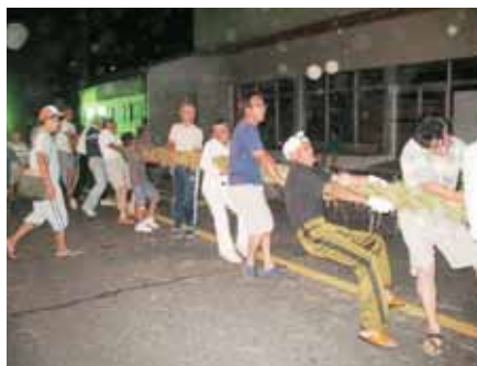
大人も子どもも綱引きに夢中になり何番も勝負した塩屋の綱引き