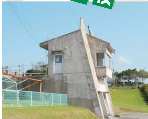
錦江町総合運動公園陸上競技場管理棟