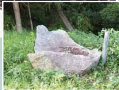
完成した水飲み場（現在）