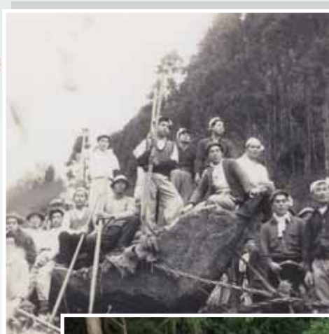
水飲み場となる、切り出した岩の上で