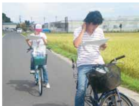
▲少しでも地域を知るために自転車で町内巡り。