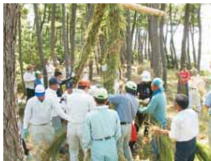
久しぶりの綱練りに多くの方が参加した馬場地区の綱引き