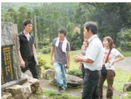
▲歴史や風土について講義を受けています。

います。お世話になったみなさん本当にありがとうございました。錦江町に来て本当に良かったです！