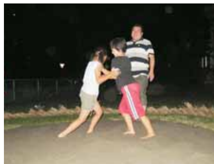
女の子も真剣勝負！大いに盛り上がった花瀬地区の相撲