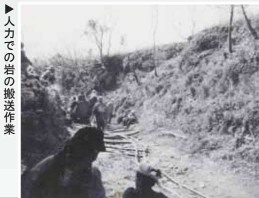
人力での岩の搬送作業