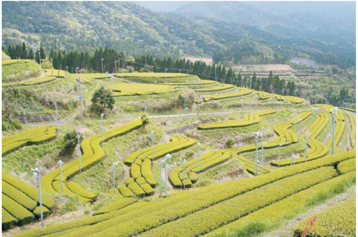
富田坂から見える茶畑(大原地区にて撮影)