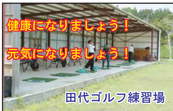
田代ゴルフ練習場