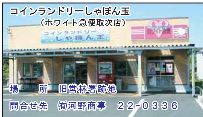
コインランドリーしゃぼん玉 (ホワイト急便取次店)