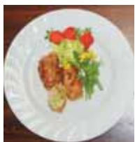
塩もみきゃべつの ポークロール エネルギー 224 kcal