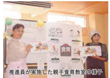
推進員が実施した親子食育教室の様子

申し込み方法 ：受講を希望される方は、5月21日(月)までに保健福祉課(電話：22-3044)栄養士までお申し込み下さい。