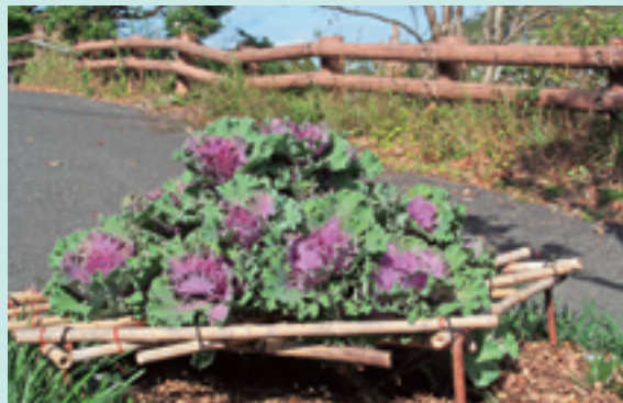
←花瀬公園に植えられている葉牡丹。写真では分かりづらいですが、1本の茎からたくさん枝分かれしています。