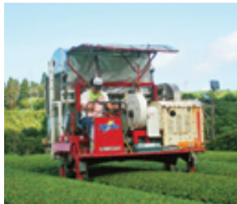
茶農家での農業体験。機械で茶摘みに挑戦しました。

● 定期的に役場と地域住民の意見交換会を開催するべきである。交流を深める上でも、交流会を兼ねて開催することが望ましい。定期的に行っていくことでよりよい廃校舎利用計画を立てることが出来るのではないだろうか。