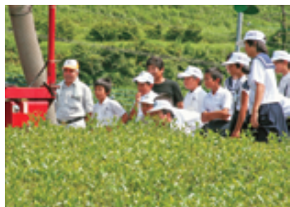
盤山の茶園。タイミングよく機械で作業する風景を見ることが出来ました。

● 町内交流の出来るようなイベントを行い、2つの地区が認め合いながら、「錦江町」という1つの町であるという意識を作り上げることが重要ではないか。