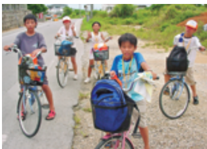
自転車での島内めぐりの様子。