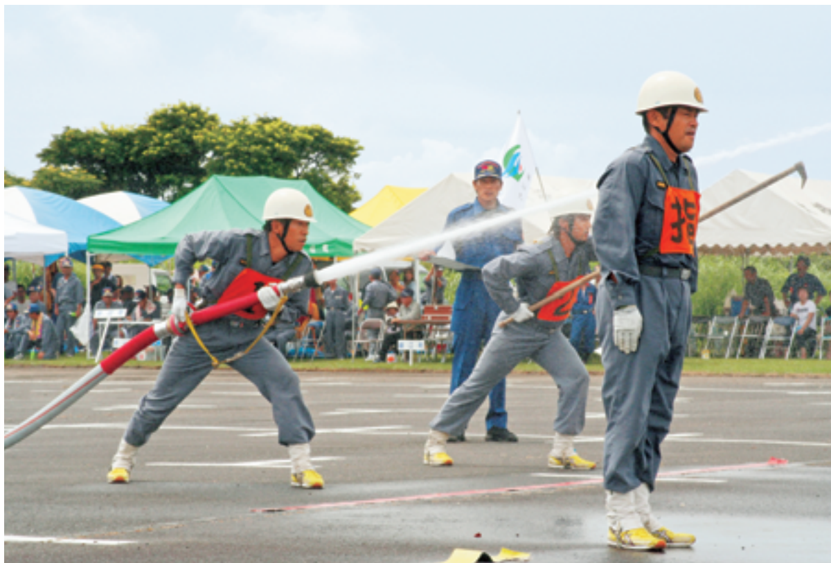
肝属支部消防操法大会 (関連記事 6 ページ)