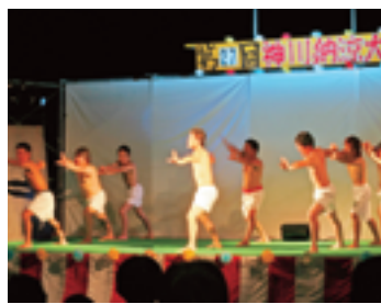
神川納涼大会にて。前日の準備から参加し、すっかり青年団に溶け込んでいました。

域住民がどの程度参加できているのか。また、どのように考えているのかが見えてこなかった。住民がどのように関わっていくのか、という問題を考えることは今後の地域づくりの重要な鍵になると感じた。