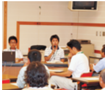
報告会にて。錦江町にとって、貴重な提案をしてもらいました。