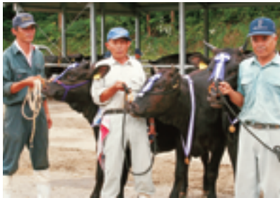
田代地区特別賞受賞者

みなさんからの情報をお待ちしています。 企画課までご連絡ください。 ☎22-3032