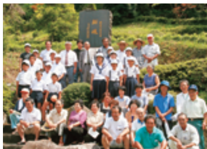
盤山集落センター敷地にある「拓魂」の石碑の前で盤山の皆さんと。

そのほか、神川大滝・つり橋の見学、花瀬でのキャンプやニジマス釣り体験、カブトムシ捕りなどの体験を行いました。 3日間の滞在でしたが、夏休みの良い思い出になったのではないのでしょうか。 トワイライトやパナウル少年の船などの実施により多くの交流が図られ、人的ネットワークが広がることを期待します。