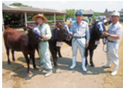
大根占地区特別賞受賞者