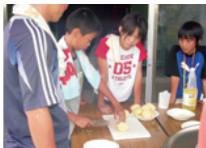
班別活動による野外炊飯。みんなで協力しておいしいご飯が出来ました。

期間当初は台風の影響が心配されましたが、3日目からは好天に恵まれ、若干の予定変更があったものの、無事活動を終了することができました。短い期間ではありましたが、黒糖搾りや自転車での島内めぐり、与論町の歴史を勉強するなど、与論町の人々にふれあい、いろいろな体験をすることができました。