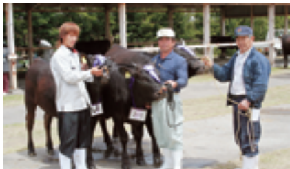
大根占地区特別賞受賞者