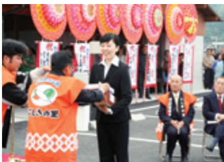
名称募集採用者記念品贈呈

また、オープンから3日間にわたって行われた、豪華賞品が当たる抽選会も大変好評でした。にしきの里では、錦江町内でもとれた農林水産物や加工品を多数取り揃えております。町内外からの多くのご来館をお待ちしております。