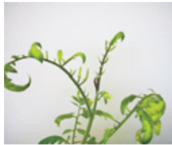
わき芽などが、やなぎ葉状になる。

しかし、トマトの草勢や気象条件により、やなぎ葉状になったり、生理障害と似た症状になったりします。