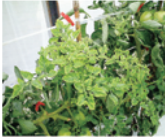
葉が黄化し萎縮する。

このウイルス病は、「コナジラミ」が伝染するため、コナジラミのハウス内の侵入防止と防除を徹底することが大切です。