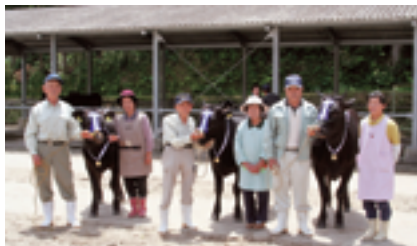
田代地区特別賞受賞者