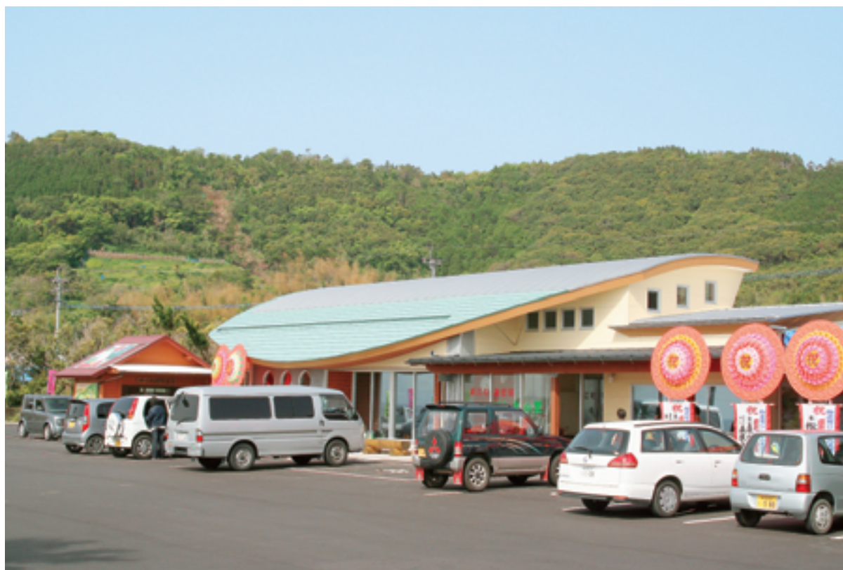
錦江町物産館「にしきの里」オープン (関連記事 4 ページ)