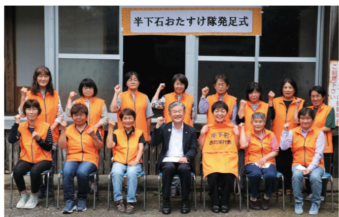
「半下石おたすけ隊」発足式

自然・環境の元気 錦江町の森林資源をしっかりと守り育てるために、6月議会において「森林の整備保全に関する条例」が可決されました。1月から伐採等の契約1か月前に役場へ届け出ている