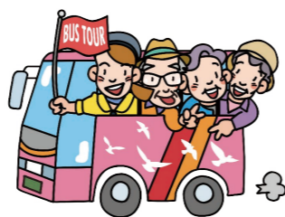
社協で日程調整後 おでかけドライブ支援

利用される1週間前までに予約が必要となります。なお、希望日の予約状況によりお受けできない場合がありますので、ご了承ください。