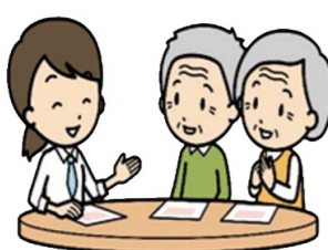
登録団体利用申請 (様式1)