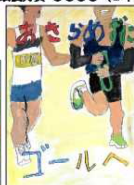
最優秀賞 OOOO (4年)