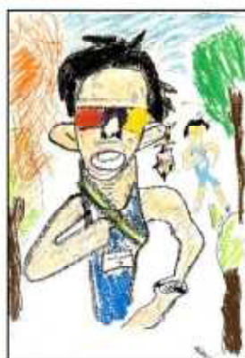
最優秀賞 OOOO (2年)