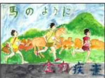
最優秀賞 OOOO (6年)