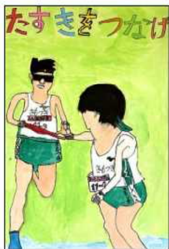
公民館長賞 OOOO (4年)