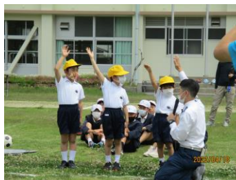
横断の練習、頑張っています！

4月18日(月)、交通安全教室を行いました。毎年行っている、命を守るための大切な学習です。交通安全や安全な過ごし方については、今後も年間を通して随時指導していきます。