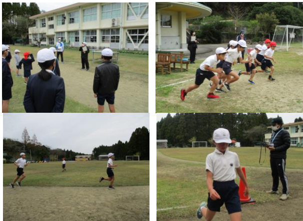
《みんな目標に向かってがんばりました》

子供たちは御家族の声援を受けて精一杯走り抜きました。アップダウンがある厳しいコースにもかかわらず、全員が完走できたことが何よりでした。この頑張りは、必ずこれからの人生に生かされることでしょう。