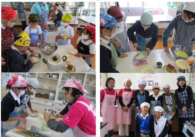
《自分たちで作った料理はおいしいね！》

子供たちは、おいもを切ったり、材料を混ぜたりと、とても楽しそうに活動していました。自分たちで作った料理はとてもおいしかったようで、終始笑顔の活動になりました。