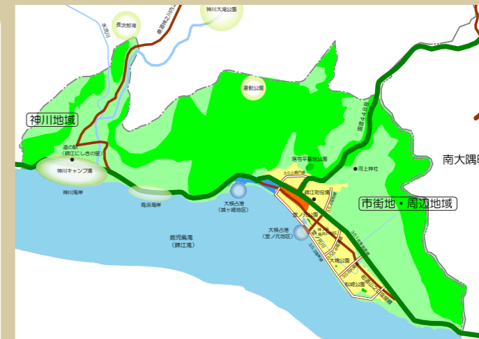
都市計画区域の整備、開発及び保全の方針図