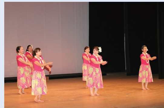
南大隅町より錦江町文化祭に出演した 佐多フラダンス同好会