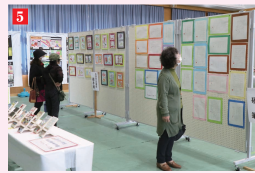
1 コール錦江 2 智賀流聖燐会 3 錦江中学校 (ナプア・レア) 4 インリーダー研修発表 5 公民館講座や各教室による作品展示