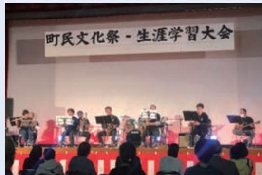
南大隅町民文化祭に出演した ジョイスウンズ