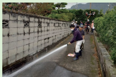
火災防ぎょ訓練の様子

秋季火災予防運動の一環として、山之口自治会と合同火災防ぎょ訓練及び移動防災教室を行いました。山之口自治会は住宅密集地で狭い道路が多い地区のため、火災が発生した場合、延焼により甚大な被害が出る恐れがあることから訓練を提案。多数の住民の方に参加していただき、初期消火の重要性について説明し、実際に消火器・消火栓を使用した訓練を実施しました。