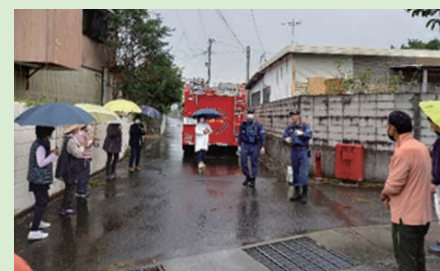
移動防災教室の様子

南部消防署では、管轄地域の自治会との合同訓練を受け付けていますので、ご希望の自治会がありましたら、ご連絡ください。