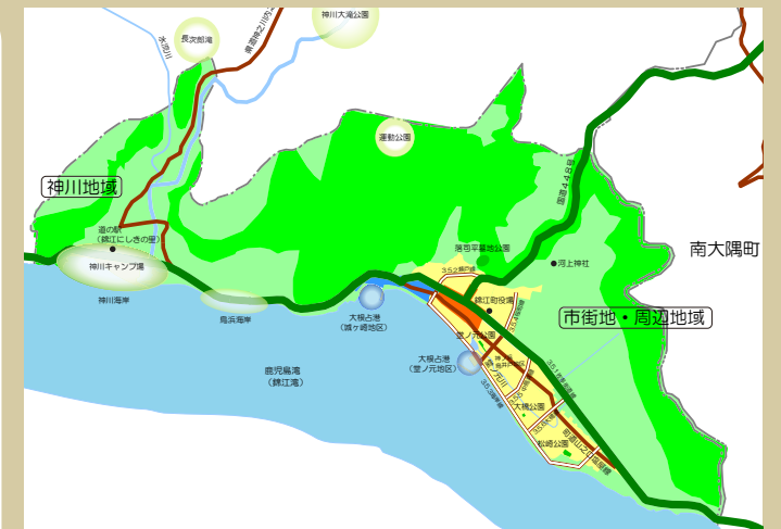
都市計画区域の整備、開発及び保全の方針図