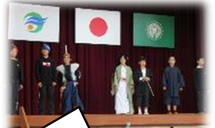
5・6年「一寸法師リターンズ」