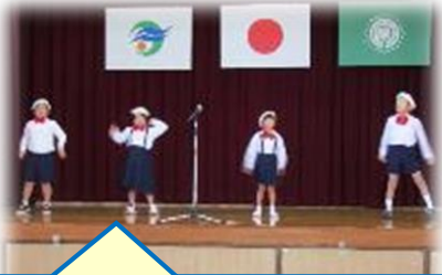
1・2年「ことばであそぼう！」

期間中に開催された学習発表会は2年振りに地域の方が参観して下さるということもあり、子供たちは張りきって練習に励んできました。どの学年も堂々と発表することができました。