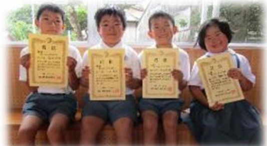
錦江町図画作品審査会 (写真左より)