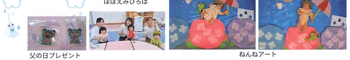
父の日プレゼント