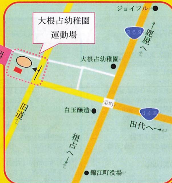
認定子ども園大根占幼稚園周辺