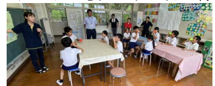
【毎週水曜日のフツ化物洗口】

一輪車（一校一運動）では、運動会での全員演技を目標に練習を継続しました。その成果として「体力アップ！チャレンジかごしま」の3・4年生が「一輪車でGO」で県7位に