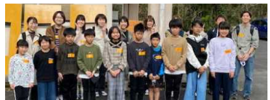
【大学生のみなさんと一緒に】

成果と課題をしっかりと捉え、小規模校のよさを生かした活力ある学校をめざして次年度も取り組んでいきます。保護者・地域・関係機関の皆様方に、令和2年度の本校の教育活動に対する深い御理解と御協力をいただきましたことに感謝申し上げます。