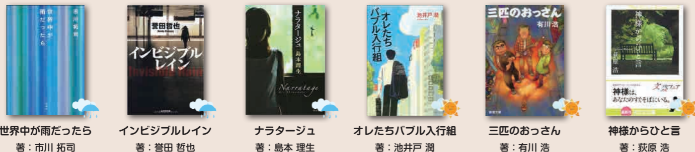
世界中が雨だったら 著：市川拓司 インビジブルレイン 著：菅田哲也 ナラタージュ 著：島本理生 オレたちバブル入行組 著：池井戸潤 三匹のおっさん 著：有川浩 神様からひと言 著：荻原浩