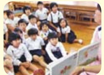
本は友だち。たっぷり読もう！