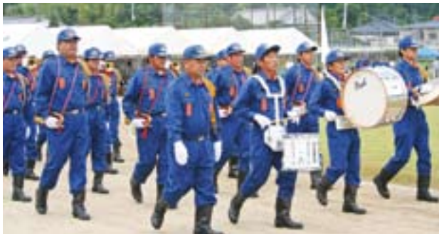
消防団員の力強い行進

10月11日、秋晴れの下、第5回町民体育大会が田代中央運動場で盛大に開催されました。 大会は各地区の健脚自慢、力自慢が勢ぞろいし、白熱した競技が繰り広げられました。また田代幼稚園・川原保育園の園児たちや婦人団体などのアトラクションなどが華を添えました。 そして、大変な盛り上がりを見せた今大会は圧倒的な強さを見せた池宿地区が初優勝を飾りました。また、応援部門では城元地区が2年連続で最優秀賞を獲得しました。