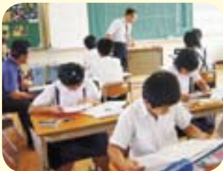
真剣に考えることは尊い！