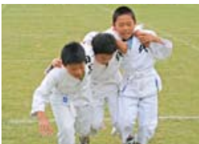
また、ひっくいかわっど…。