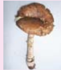
東串良町柏原海岸の松林に自生していたテングダケ