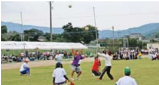
もちょっと左せえ！