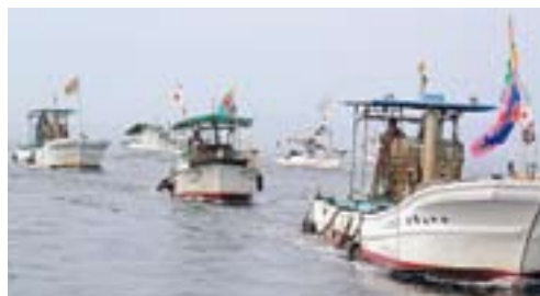
勇壮な漁船パレード