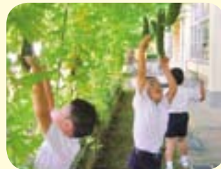
緑のカーテン。涼しいよ！