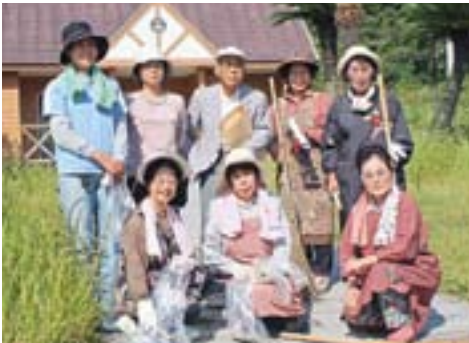
今から掃除始めます！ (町境公衆トイレ班)