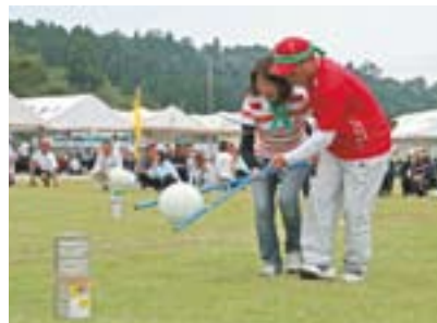
くりんくりん、すんなて！