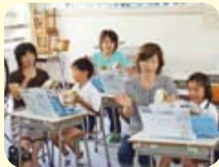
♪お母さんと一緒に♪