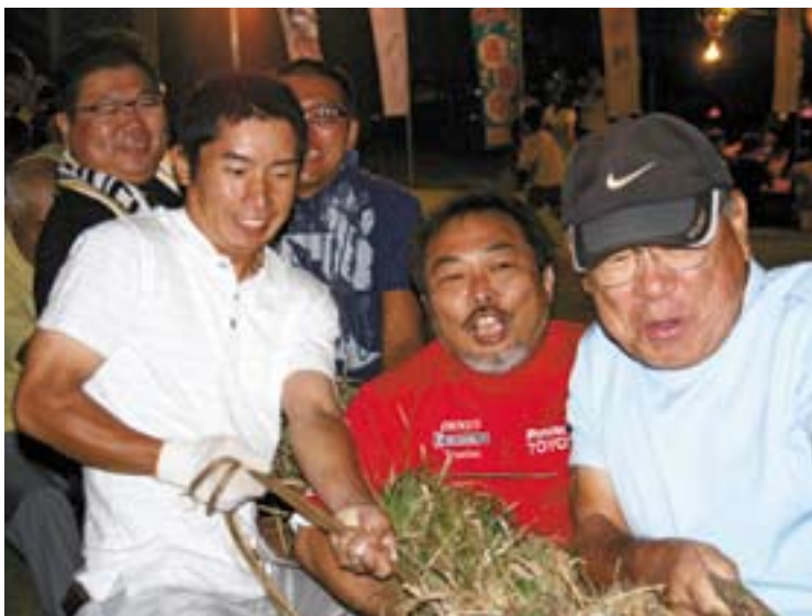
馬場地区公民館での綱引きの様子