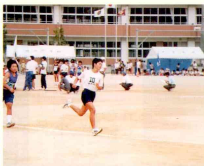
陸上競技 (13日・根占町)