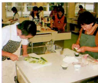
うまい包丁さばき!!