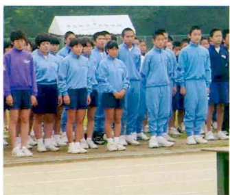
決意を胸に 開会式に臨みます。

日ごろの練習で培った力を出し切りました。その結果、陸上競技で9名が、また、剣道男女団体、女子個人で剣道部が、県大会への出場権を得ました。