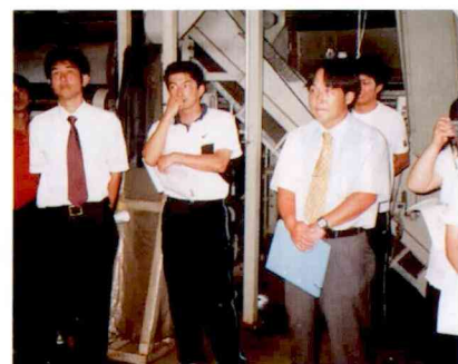
真剣な面もちの参加者