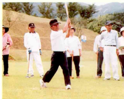
グラウンドゴルフ (13日・田代町)