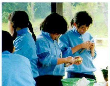
スペシャルカレー つくるぞ!!