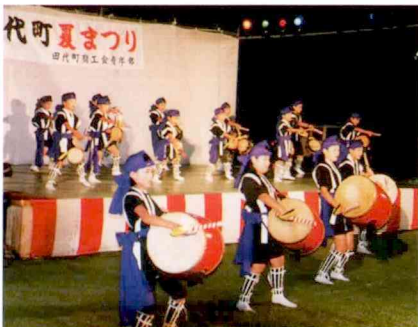
見事なオープニング