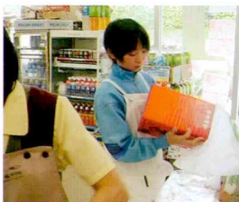
働くって楽しい でも、大変だね。