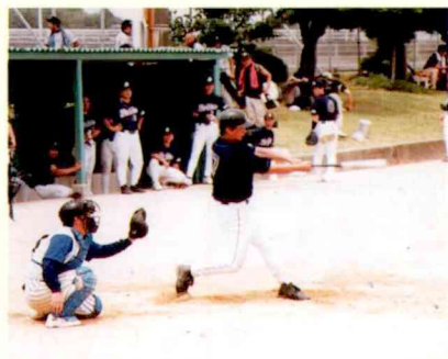
軟式野球 (12, 13日 根占町, 大根占町)