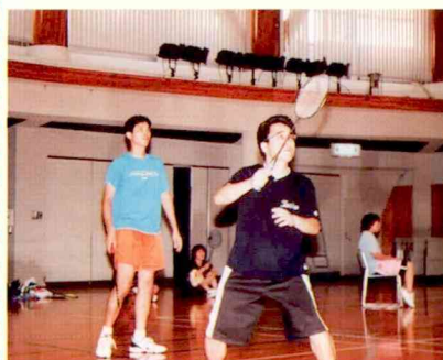
バドミントン (13日・佐多町)