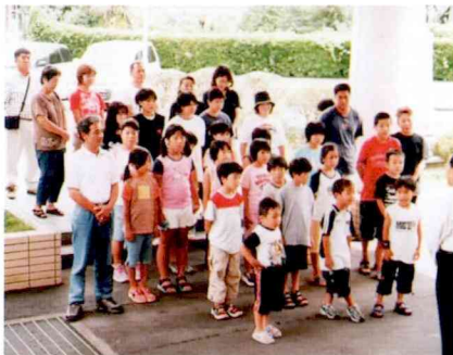
ようこそ田代町へ

7月25日(金)、町納涼夏祭りの中で、伊仙町よりエイサー太鼓の方々が来町し、見事な太鼓演奏をしてくださいました。翌日と翌々日には、田代町内を回って、楽しい思い出を作っていました。