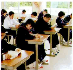
本は心の栄養です。

たくさんの思い出ができた1学期でした。充実した夏休みを過ごして、元気に2学期をスタートしたいと思います。