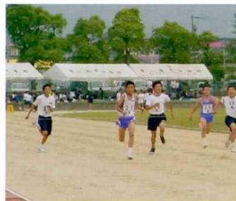
県大会でも、力いっぱい がんばってきます。