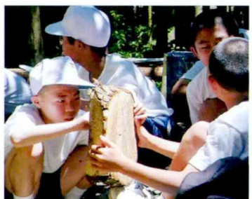
この木は 何年生きたのかなあ。