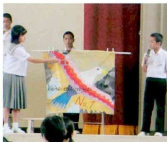
〈2年生〉 夢をおいかけて はばたいていきます