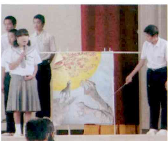
〈3年生〉 1人はクラスのために クラスは1人のために!