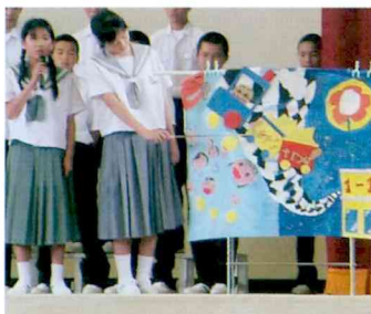
〈1年生〉 “レッツ トライ!” がんばります