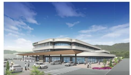
【新医師会立病院完成予想図】

先月末のニュースでは、日本の農業生産物の輸出額が過去最高と出ていた。日本の農業生産物の水準の高さが世界に認められていることだと思い、改めて日本の農業は、素晴らしいと感じた。ただ喜んでばかりもいられない。日本の食糧自給率は、先進国の中で、最低の38%。しかも、農作物を育てる上で必要な飼料や種子の自給率まで考えると、実質的な食糧自給率は、なんと10%程度という状況なのだそうである。加えて、日本の農家の平均年齢は、2022年の段階で、68.4歳。この方々が元気にあと何年働くことができるかということを考えると、日本の農業はやがて大変な状況を迎えることがはっきりとしている。このような他国依存の日本の食糧事情をさらに悪化させているのが、遠く離れたウクライナやイスラエル、パレスチナ等の紛争である。身の回りを見渡して欲しい。かなりの品目が値上がりの一途をたどっている。おまけに、円安の状況が長期にわたり続いているため、ますます輸入品の値段は上がる一方である。一例を挙げてみよう。輸入品ではないが、食料というより、嗜好品。多くの人が好んで食べているポテトチップス。この1年で32%も値上がりしているそうだ。先日、コンビニで買おうと思ったら、以前より量が少なくなった上に、値段も160円。手に取ったが、買うことを留まってしまった。ポテトチップスが登場した昭和50年代。女優さんが「100円で〇〇ビーのポテトチップスは買えますが、ポテトチップスで100円は買えません。あしからず。」とCMで、言っていた。当時90g、100円で売られていた(それでも高いと感じ、家で食べる機会は我が家にはほとんどなかったが…)。今や、60gで150円(参考価格)。おまけに今後も値上げの動きは止まらないであろうという予測がなされている。悲しい限りだ。