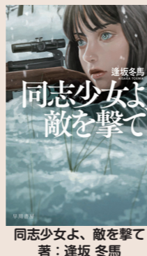
同志少女よ、敵を撃て 著：逢坂 冬馬

《ストーリー》独ソ連が激化する中、少女セラフィマの日常は突如として奪われた。訓練学校で一流の狙撃手になることを決意したセラフィマ。母を撃ったドイツ人狙撃手と、母を死に追いやった者たちへの復讐を誓う。おびただしい死の果てに、彼女が目にした”真の敵”とは？